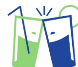
Le Défi De Janvier