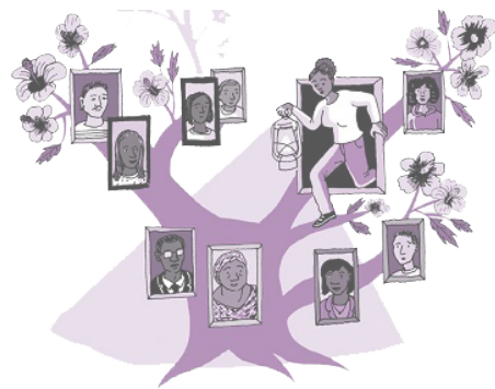
Illustration : Jean-Pierre P. / A. F.

Seul programme de prévention qui s'intéresse à la transmission des addictions de génération en génération, « Une Affaire de famille ! » s'adresse à toute personne adulte qui désire comprendre les conséquences de son vécu familial sur sa vie actuelle. L'Association travaille aujourd'hui sur le déploiement en milieu carcéral de ce programme actuellement mis en œuvre dans plusieurs régions de France.